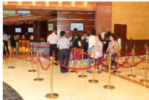
【カジノフロア入口】