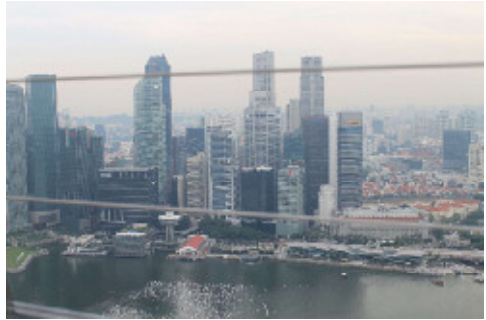
【高層ビルが立ち並ぶシンガポール】