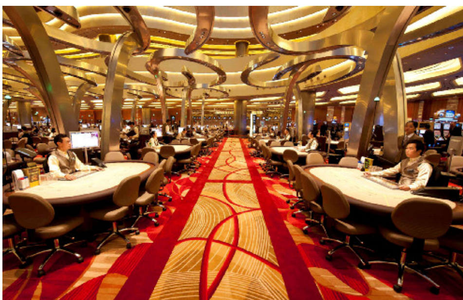
【カジノ会場：カードゲームエリア】