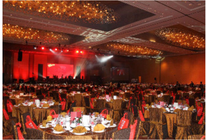
【大規模会議室会場】

・マリーナ・ベイ・サンズはショッピングエリアはもちろんのこと、数千人規模のイベントが行える会議棟、アートサイエンス・ミュージアム、シアター等のMICE施設について充実している。ただし、カジノ以外の施設については利益を出すのが難しいといわれており、MICE施設の赤字を前提としてカジノによってリゾート全体の利益を確保するビジネスモデルといわれる。