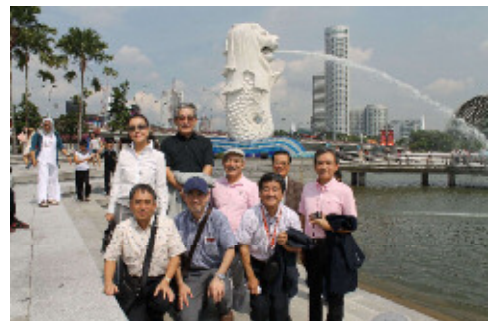
【マーライオン公園にて】