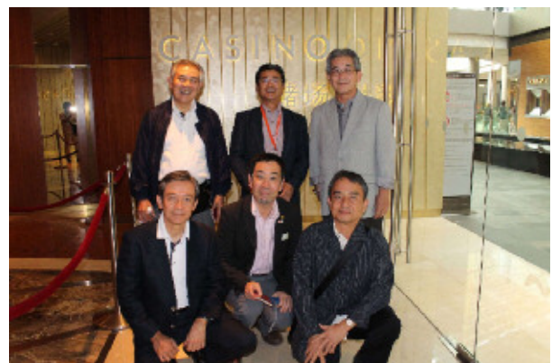
【カジノエリア入口】