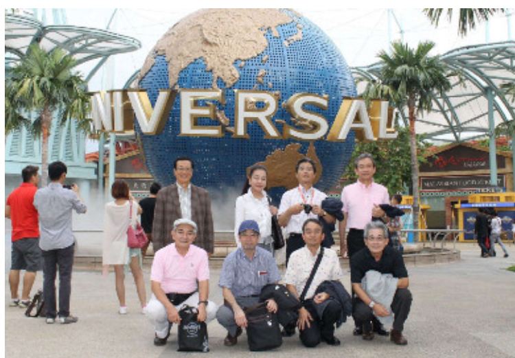
【ユニバーサルスタジオ：RWS内】