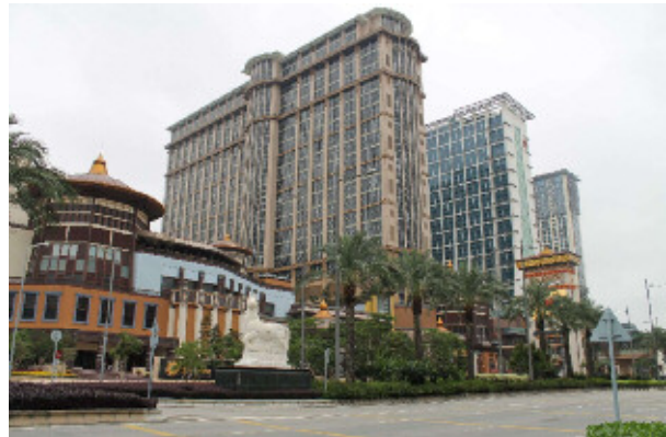
【リゾート地区のカジノホテル】