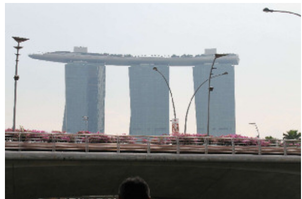
【マリーナ・ベイ・サンズ外観】