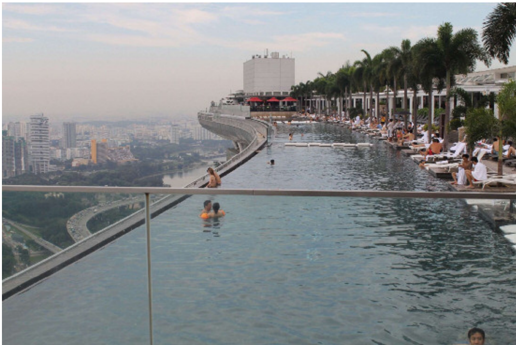
【屋上プール：宿泊者のみ利用可】