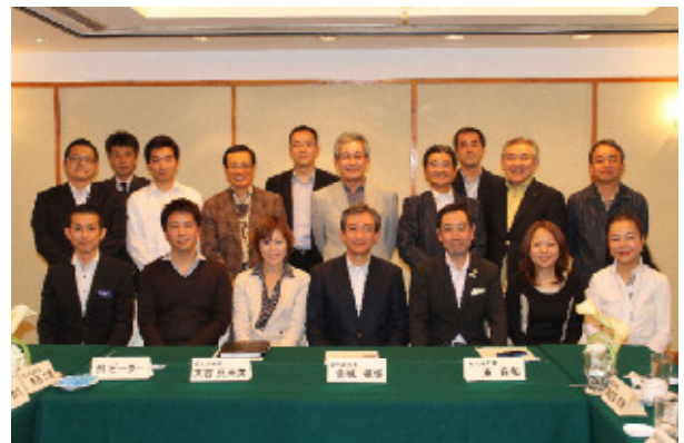
【香港在県経済人との意見交換会】