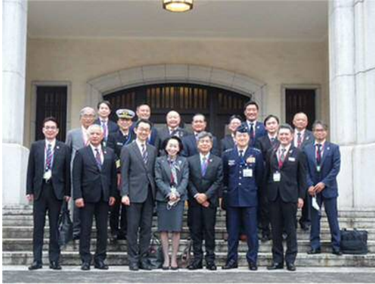
防衛省市ヶ谷庁舎