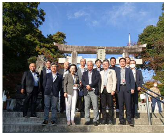
恵林寺・武田神社

視察4日目は、東は後立山、西は立山連峰に囲まれ、北アルプスの豊かな大自然に抱かれ、えん堤の高さ196mと日本一を誇り、長さ492mとなだらかな美しいアーチを描き、観光放水で流れる水量は圧巻の毎秒10t以上で知られる世界屈指の黒部ダムを視察することができました。黒部ダムは、黒部川第四発電所、通称「くろよん」の名で親しまれる関西電力の水力発電用ダムです。扇沢駅と黒部ダム駅を結ぶ全長5.4kmの関電トンネルを電気バスに乗って黒部ダムに向かいました。最大13度の急勾配の関電トンネル内は、夏でも気温は10度前後であり、苦闘の末に突破した大破碎帯から現在も流れる水を見ることができました。