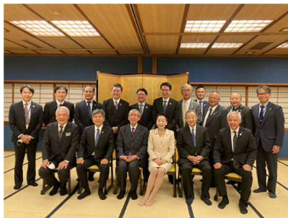
金沢経済同友会との懇親会

視察6日目は、視察最終日、水戸偕楽園、岡山後楽園とならぶ日本三名園の一つに数えられる、加賀藩によって金沢城の外郭に造営された廻遊式の庭園である「兼六園」に立ち寄ることができました。兼六園は、宏大・幽邃・人力・蒼古・水泉・眺望の6つの景観を兼ね備えていることから命名されたとのこと。魅力引き立つ景観を楽しみながら回遊する庭園を沖縄観光の参考にできないものかと思入ってしまいました。