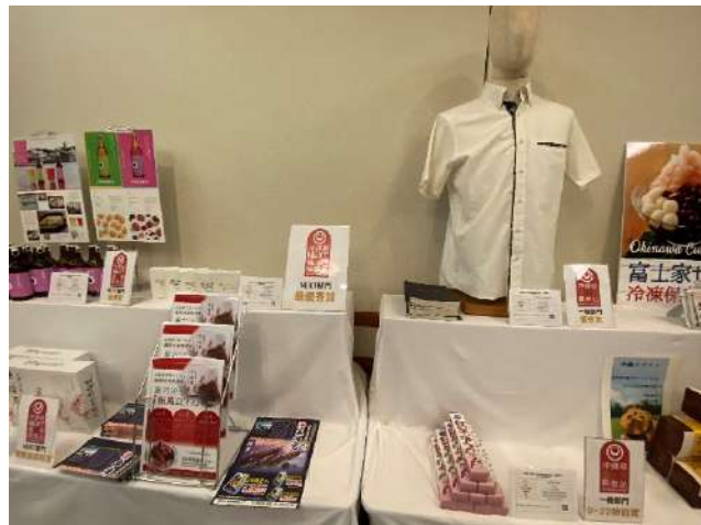
(「沖縄県優良県産品 展」 in 沖縄大交易会)