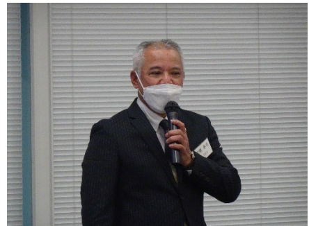
(當銘副代表幹事の総括)