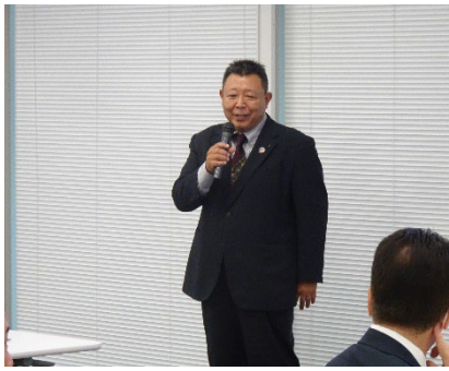
(上運天委員長の開会挨拶)