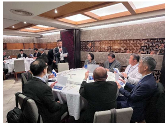
< 近鉄エクスプレスによる卓話 >