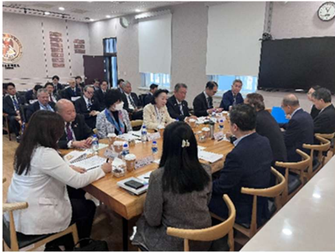
< 国防安全研究院 >