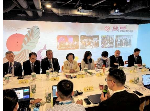
< 台日産業連携推進オフィス (TJPO) >