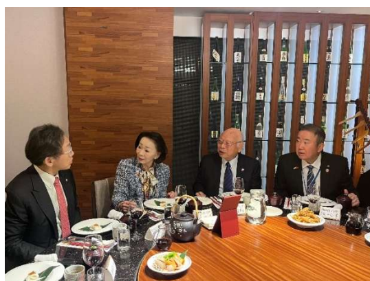
<三三会との交流会>

また、今回の視察では、台湾を代表する経済団体である三三会（毎月第3水曜日に定例会合を行うことから命名）の交流も行った。入会資格が台湾の企業グループのトップ100であり、会員企業の総売上高は台湾GDPの相当な割合を占める団体の幹部が歓迎の会を開いてくれたことは、今後の台湾と沖縄の民間交流を進めるうえで、重要な一歩になったと考える。