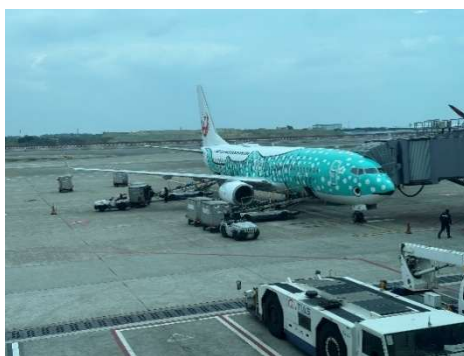
<JTAのジンベイジェット>

本視察の実施にあたり、現地調整や企画運営にご尽力いただいた近畿日本ツーリスト様と沖縄経済同友会事務局、就航間もない台湾直行便にて快適な空の旅をサポートいただいた日本トランスオーシャン航空様、そして関係者各位に、心より感謝申し上げます。